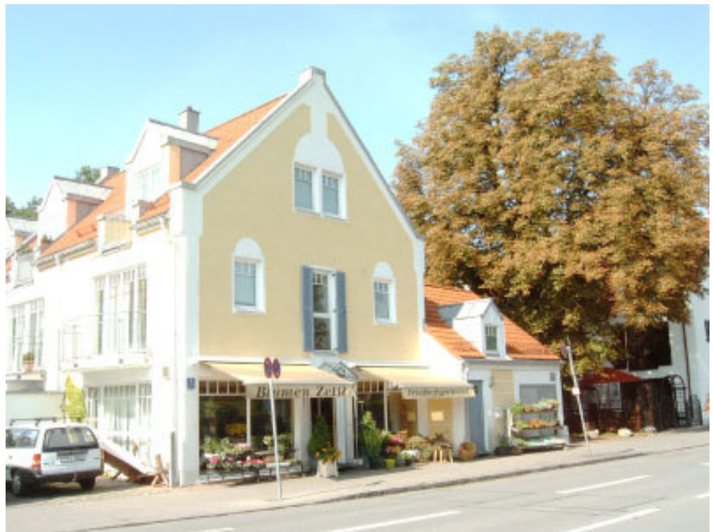
Neubau auf dem "Michlbauer"-Hofgrundstück: Eversbuschstraße 5